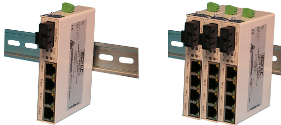
Boîtier avec fixation rail Din intégrée