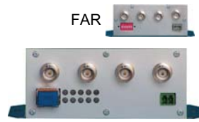
Boîtier individuel -FAV