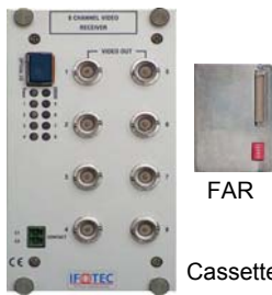
Cassette 14TE -FAV