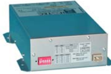
Boîtier individuel FAR