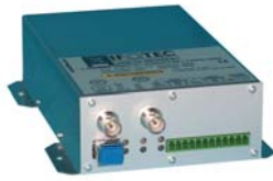
Boîtier individuel FAV