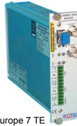
Cassette Europe 7 TE